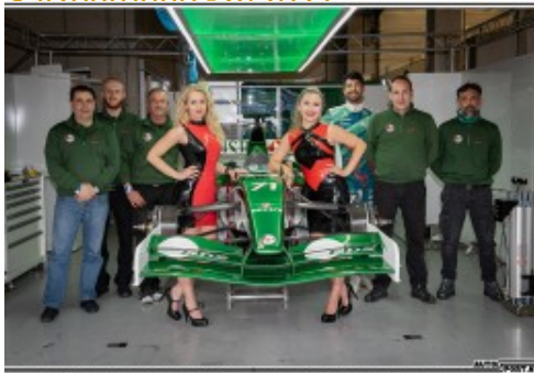
8055 GP - P9 Race Weekend - 21-22-5-2021 - Red Bull Ring