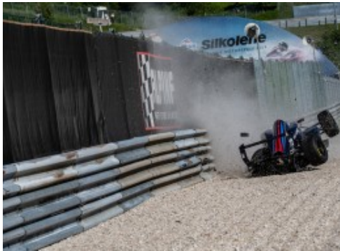
Drexler Formel Cup - XLR8 - Salzburgring - 6/2021