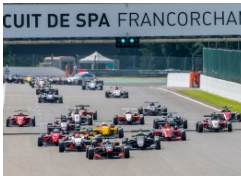
Drexler Formel Cup - Spa Summer Classic - 6/2021