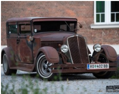
Hudson V8 1921